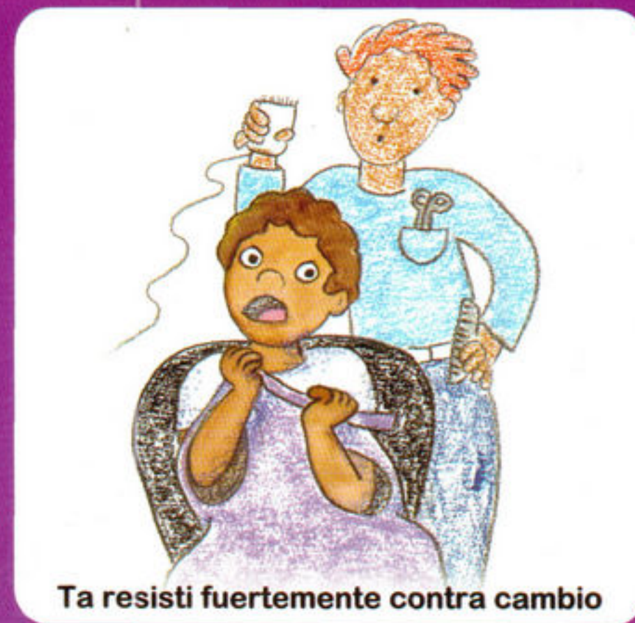
Ta resisti fuertemente contra cambio